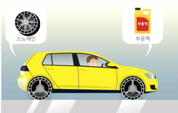
도로가 얼 수 있으니 차에 스노체인 등 월동용품을 준비하고, 부동액 등 자동차 점검을 합니다.