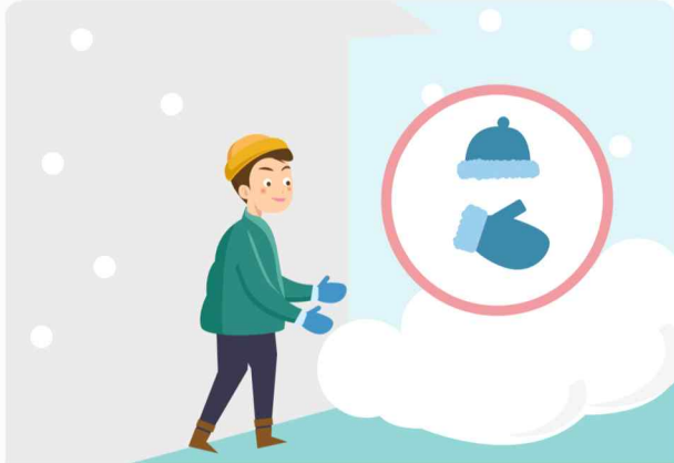
외출 시에는 동상에 걸리지 않도록 보온에 유의합니다.

겨울철 한파 피해 최소화를 위해 다음과 같이 국민행동요령을 알려드리니, 적극 홍보하여 주시기 바랍니다.