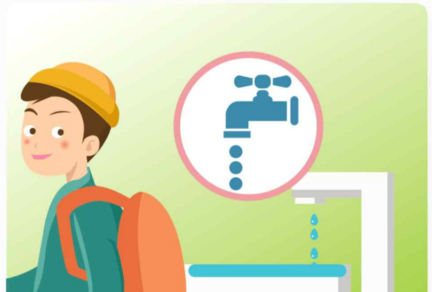
장기간 외출 시 온수를 약하게 틀어 동파를 방지합니다.