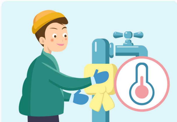
수도계량기, 보일러 배관 등은 헌 옷 등으로 보온합니다.