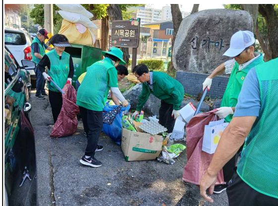
저소득가정 아동 영화관람 지원 / 통장협의회 음식점 친절·청결 캠페인 우리동네복지기동대-119소방대 합동 안전점검 / 새마을 시가지 청결활동 추진