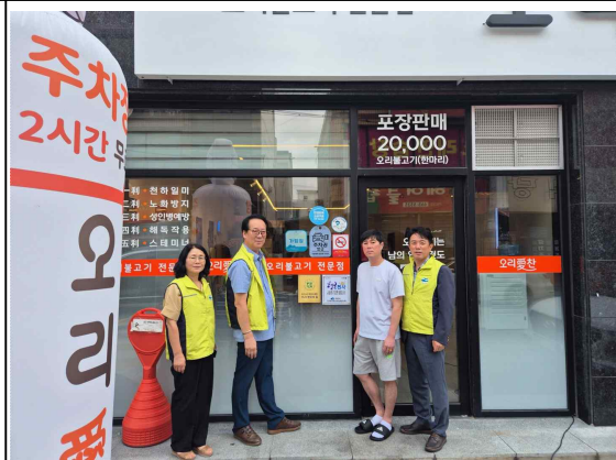
시전동 노인회 이순신 마리아 요트 체험 / 민생회복 소비쿠폰 소비촉진 캠페인 추석맞이 경로당 위문품 전달 / 우리이웃 행복천사 가게 현판 전달식