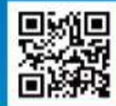
[사진 공모전 관련 우리 청 공지사항]