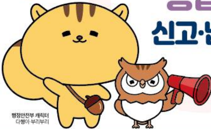
행정안전부 캐릭터 다행이-부리부리